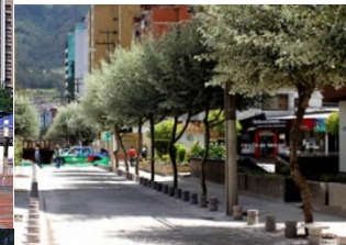
AV República del Salvador - Quito