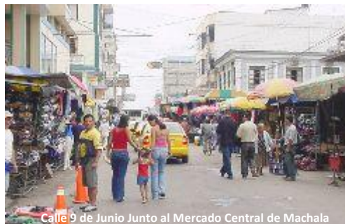
Calle 9 de Junio Junto al Mercado Central de Machala

El siguiente cuadro presenta, de manera esquemática, las principales normas existentes.