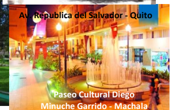
Paseo Cultural Diego Minuche Garrido - Machala