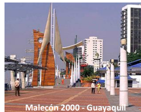
Malecón 2000 - Guayaquil

Es fundamental reconocer la importancia del espacio público por cuanto éste es propiedad de todos y, por lo tanto, prima sobre los intereses privados. Su recuperación genera bienestar y mejora la calidad de vida diaria de los habitantes de las ciudades. Si se cuenta con espacio público suficiente y que satisface las necesidades de la población es fácil prevenir y controlar la violencia; los espacios desordenados, sucios, contaminados, ruidosos e insuficientes, generan agresividad en quienes los deben usar; mientras que los espacios amplios, limpios, bien diseñados y agradables, invitan a tener actitudes más amables. 2 De esta forma se puede concluir que el espacio público contribuye a generar una ciudad más humana, con más y mejores condiciones de acceso a las oportunidades de desarrollo para sus habitantes.