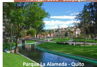
Parque La Alameda - Quito