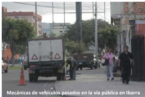
Mecánicas de vehículos pesados en la vía pública en Ibarra