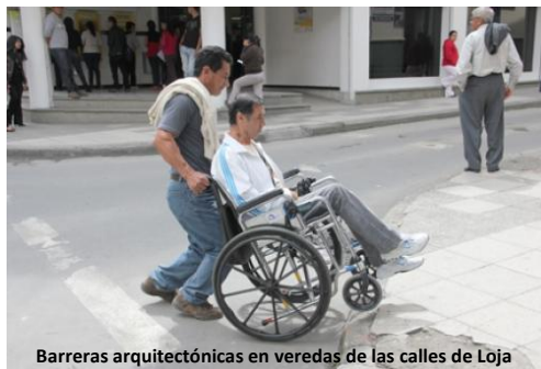
Barreras arquitectónicas en veredas de las calles de Loja