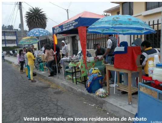
Ventas Informales en zonas residenciales de Ambato